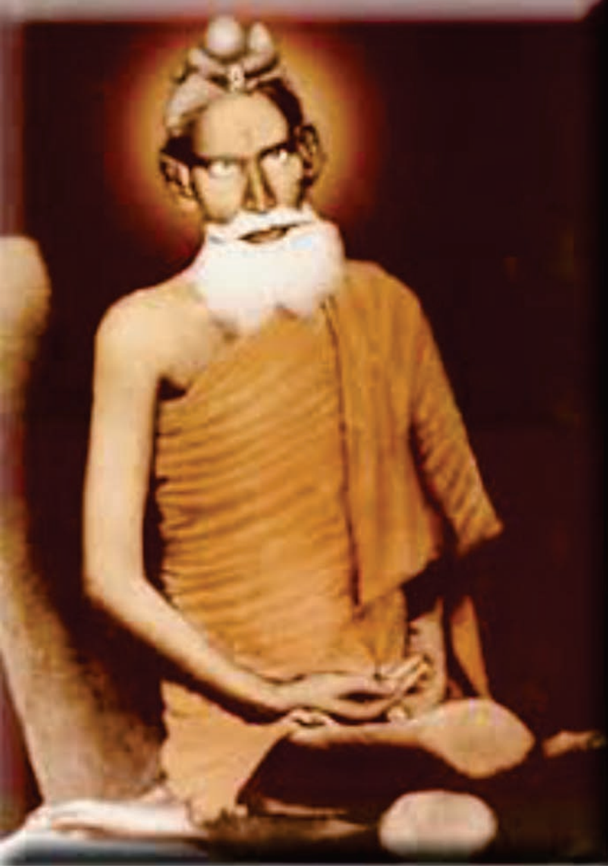
ಸದ್ಗುರು ಶ್ರೀ ಲೋಕನಾಥ್