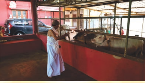
ಪೂಜ್ಯ ಗುರೂಜಿಯವರಿಂದ ಗೋಪೂಜೆ

ದಿನಾಂಕ 2ರಂದು ಸಚ್ಚಿಂತನ. ಬೆಳಗ್ಗೆ ಪೂಜ್ಯ ಗುರೂಜಿಯವರು ಬಾಬಾಜಿ ಮಂಚಿನಲ್ಲಿ ಆರತಿ, ಗೋಪೂಜೆ ನೆರವೇರಿಸಿದರು. ಬಳಿಕ ದೀಪ ಪ್ರಜ್ವಲನ, ಪೂಜ್ಯ ಗುರೂಜಿಯವರಿಗೆ ಫಲಪುಷ್ಪ ಸಮರ್ಪಣೆ, ಧ್ಯಾನ, ಯೋಗನಿದ್ರೆ, ಪ್ರಸಾದ ವಿತರಣೆ, ಭೋಜನದೊಂದಿಗೆ ಸಚ್ಚಿಂತನ ಮುಕ್ತಾಯಗೊಂಡಿತು.