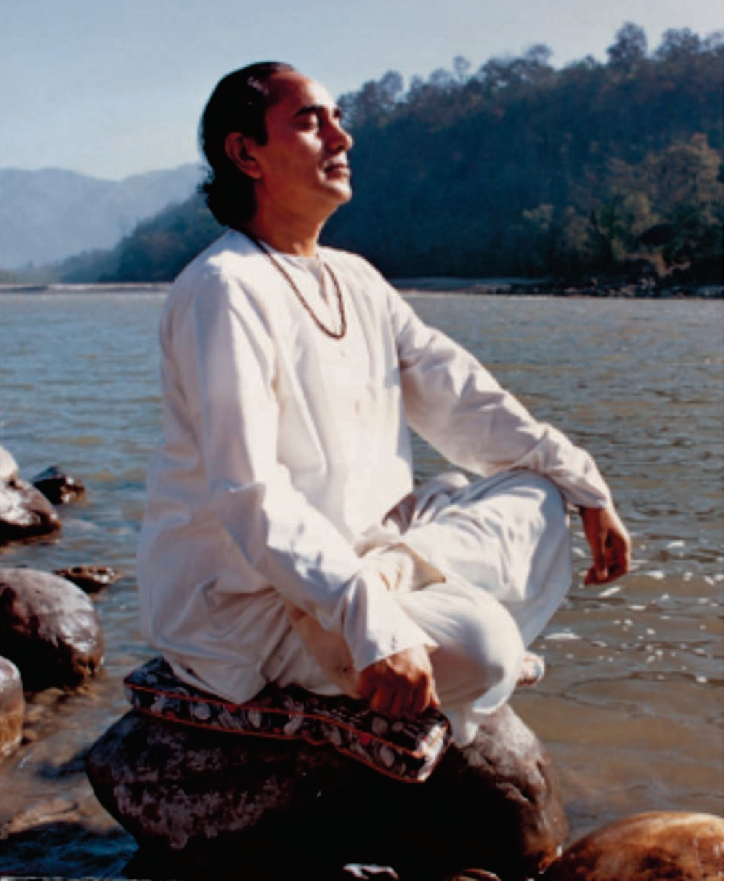
ಪರಮಪೂಜ್ಯ ಸ್ವಾಮಿ ರಾಮಾ