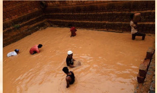
ಮಳೆ ನೀರಿನಿಂದ ತುಂಬಿಕೊಂಡ ಕೆರೆ

ಆಶ್ರಮವು ಹೊಸದಾಗಿ ಖರೀದಿಸಿರುವ ಜಾಗದಲ್ಲಿ ಮಳೆನೀರಿನ ಶೇಖರಣೆಗಾಗಿ ನಿರ್ಮಾಣವಾಗುತ್ತಿರುವ ಕೆರೆಯಿಂದ ಹೂಳೆತ್ತುವ ಕೆಲಸವನ್ನು ನಮ್ಮ ಗೋಪಾಲಕ ಹುಡುಗರು ಮಾಡುತ್ತಿದ್ದರು. ಅನಿರೀಕ್ಷಿತವಾಗಿ ತೌಕೈ ಚಂಡಮಾರುತದ ಸುಳಿವು ದೊರಕಿದ ತಕ್ಷಣವೇ ಶೀಘ್ರವಾಗಿ ಕಾರ್ಯತತ್ಪರರಾದ ನಮ್ಮ ಹುಡುಗರು ಮಿಂಚಿನ ವೇಗದಲ್ಲಿ ಕೆರೆಯಿಂದ ಹೂಳನ್ನು ಖಾಲಿ ಮಾಡಿದ ಕ್ಷಣದ ಚಿತ್ರಣ ನಿಮಗಾಗಿ