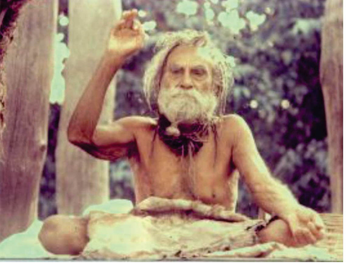
ಬ್ರಹ್ಮವೇತ ಪರಮಪೂಜ್ಯ ದೇವರಹ ಬಾಬ