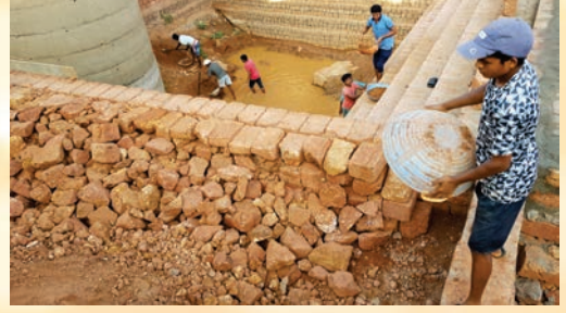
ಮಳೆ ನೀರಿನ ಶೇಖರಣೆಗಾಗಿ ಕೆರೆಯ ಹೂಳೆತ್ತುತ್ತಿರುವುದು