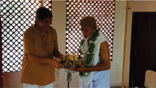
ಪೂಜ್ಯ ಗುರೂಜಿಯವರಿಗೆ ಫಲಪುಷ್ಪ ಸಮರ್ಪಣೆ