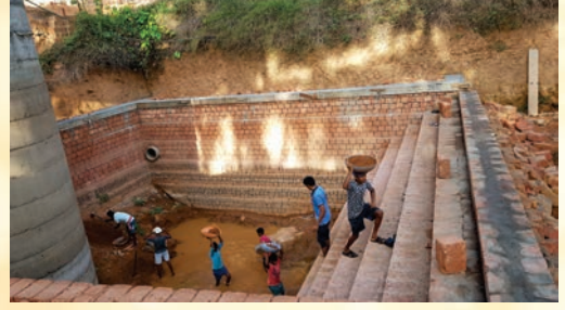
ಮಳೆ ನೀರಿನ ಶೇಖರಣೆಗಾಗಿ ಕೆರೆಯ ಹೂಳೆತ್ತುತ್ತಿರುವುದು