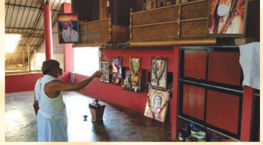
ಪೂಜ್ಯ ಗುರೂಜಿಯವರಿಂದ ಬಾಬಾಜಿ ಮಂಚಿನಲ್ಲಿ ಆರತಿ