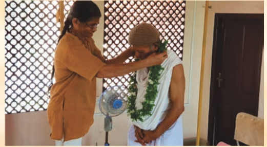
ಪೂಜ್ಯ ಗುರೂಜಿಯವರಿಗೆ ಮಾಲಾರ್ಪಣೆ